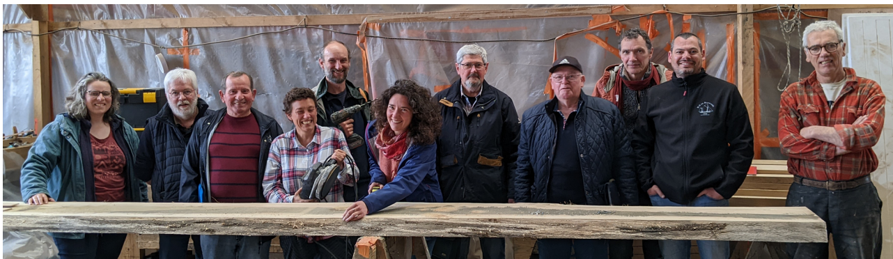
Le CA au Chantier du Guip en 2023

L'association AN TEST est une association Loi 1901 à but non lucratif. Une fois par an, au printemps, les adhérents se réunissent à l'Hôpital Camfrout lors d'une assemblée générale qui permet de faire le bilan de l'année écoulée et de se projeter sur celle à venir. C'est également l'occasion de prendre sa nouvelle carte d'adhérent et de passer un bon moment ensemble !