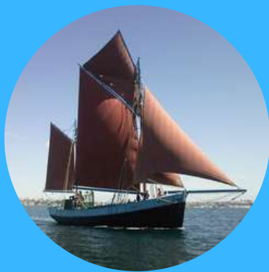
NOTRE DAME DE RUMENGOL GABARE