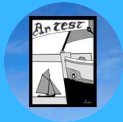
ASSOCIATION AN TEST LE TÉMOIN