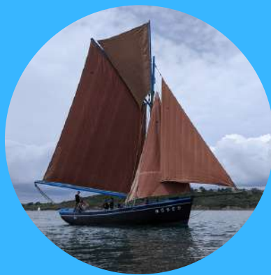
LA BERGÈRE DE DOMRÉMY COQUILLIER